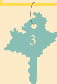
TABLE RONDE 3 : Les EnR intégrées à leur environnement

Comment faire cohabiter EnR et biodiversité, agriculture et architecture?