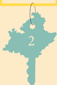
TABLE RONDE 2 : Les EnR au service du développement économique

Quelle structuration des filières, quelle relation entre innovation, recherche et industrialisation? Quelle place pour les TPE et les PME?